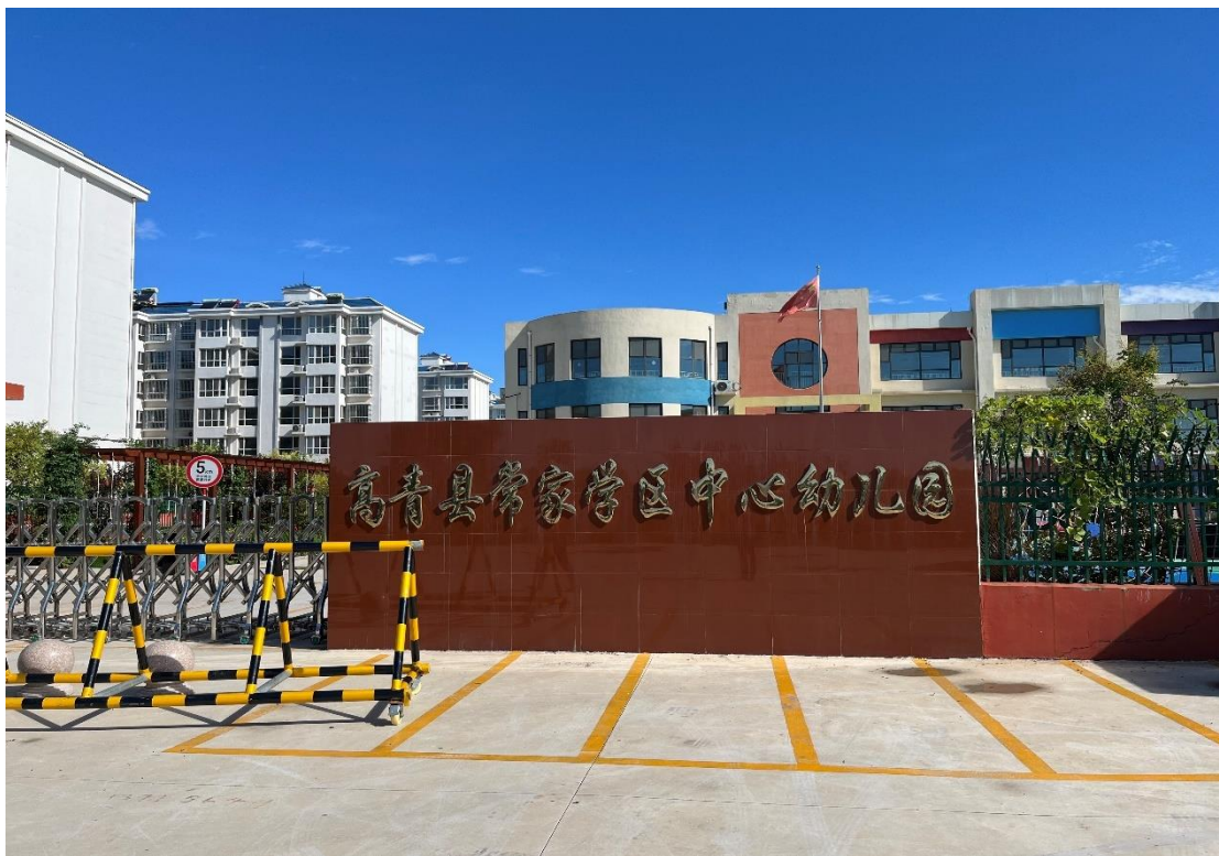
常家社区中心幼儿园