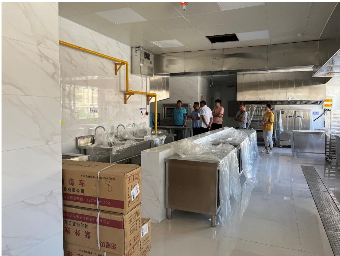
中心路小学幼儿园